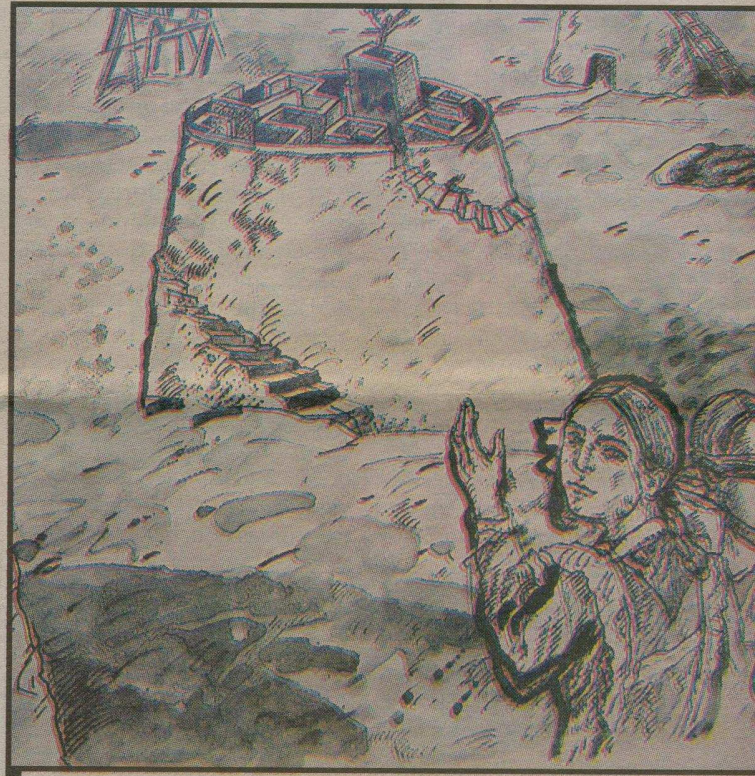
FRAGMENTO DE UNA OBRA RECIÉN IMPRESA DE IOULIA AKHMADEEVA.