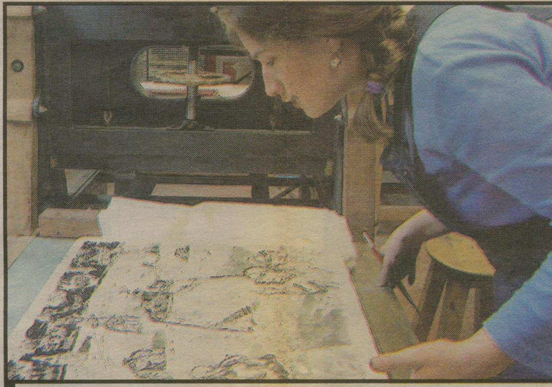
EL CENTRO DE FORMACIÓN Y PRODUCCIÓN GRÁFICA RECIBE A ESTOS 3 ARTISTAS.

Sin que precisamente, explica Rangel, hubiese una relación entre un elemento y otro llevó posteriormente esas imágenes a un tramado sobre papel, lo que resultó en un